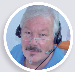
Harald Klein Konzepte & Recherche